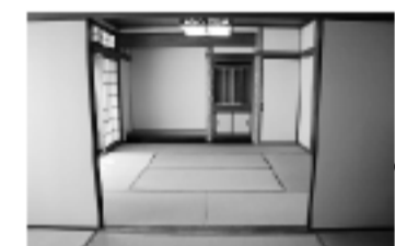
●便利な2間続きの和室