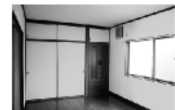
●片付けラクラク収納の多い部屋