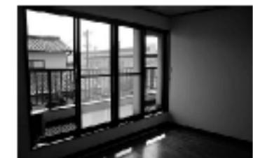
●ベランダへ続く大きな窓