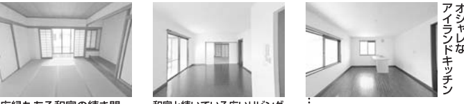
広縁もある和室の続き間 和室と続いている広いリビング