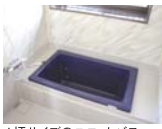
1坪サイズのユニットバス

【物件概要】●所在地/福山市神辺町新徳田2丁目●交通/JR瀬田駅より徒歩10分●構造/木造高層平屋●土地権利/所有権●地目/宅地●都市計画区域/第一種住居地域●坪単価/60%●容積率/200%●接道状況/南側幅員6m●築年月/1989年12月●駐車場/有り●電気/空室●引渡/相談●設備/上水道、浄化槽、電気●取引態様/売主