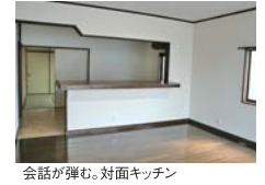
会話が弾む。対面キッチン