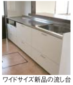
ワイドサイズ新品の流し台