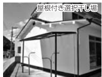
屋根付き選択干し場