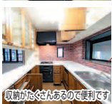
収納がたっぷりあるので便利です