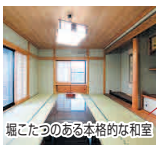
堀こたつのある本格的な和室