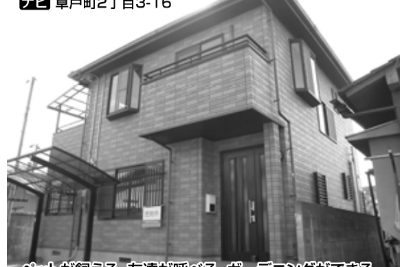
ペットが飼える、友達が呼べる、ガーデニングができる。