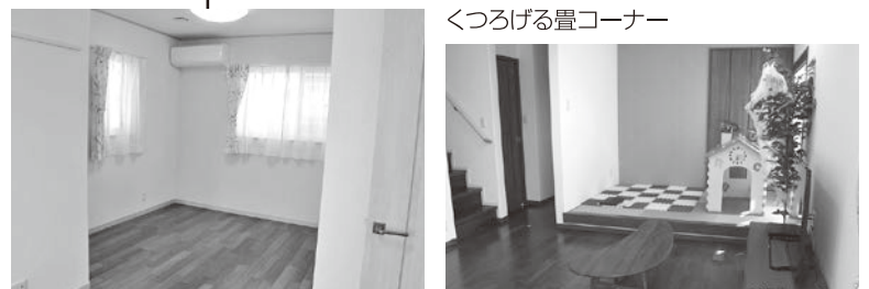
間仕切りできる2階の洋室