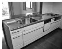
奥様が喜ばれる 対面キッチン