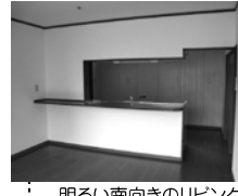
明るい南向きのリビング