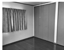
収納たっぷり2階の主寝室

■土地面積 / 162.77㎡ (49.23坪) ■建物面積 / 109.30㎡ (33.26坪)