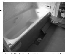
お手入れラクラクユニットバス